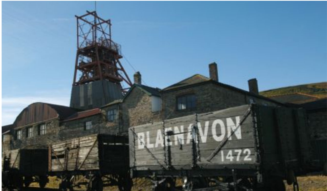
Big Pit Mine

Après-midi : randonnée-découverte du parc national Brecon Beacons et découverte du Pen y Fan , point culminant du parc.