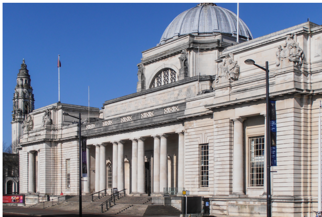
National Museum of Wales