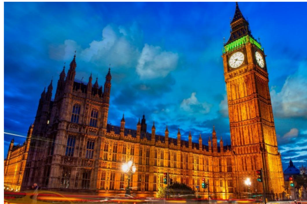
Big Ben & the Houses of Parliament