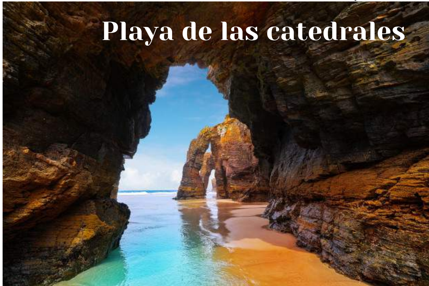
Playa de las catedrales