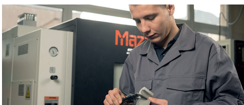
Technicien d'usinage et d'outillage

Comment produire, transporter, distribuer, transformer, gérer et utiliser l'énergie électrique ? De la conception à la maintenance des équipements, en passant par leur installation, vous intégrerez constamment les innovations technologiques et énergétiques. En route vers de nouveaux défis énergétiques et vers les énergies renouvelables !