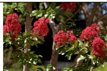
Lagerstroemia ou Lilas des Indes