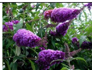
Buddleia ou Arbre aux Papillons