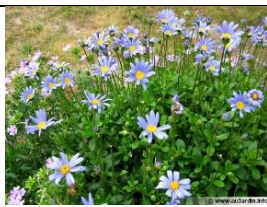
Agathea felicia ou Aster du Cap