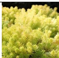
Sedum lemon ball