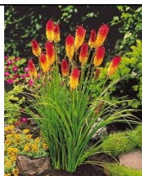
Kniphofia ou Tritoma ou Tison de Satan