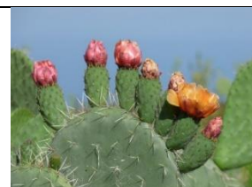
Opuntia ou Figuier de Barbarie