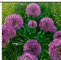
Allium sativum millenium