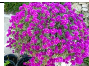
Ficoïde ou Mesembryanthemum