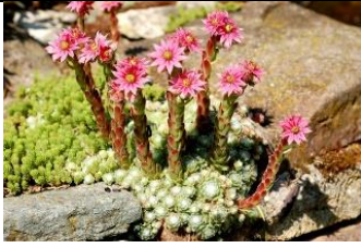
Sempervivum ou Joubarbe