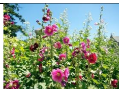
Rose trémière ou Alcea Rosea