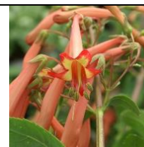
Phygellus ou Fuchsia du Cap