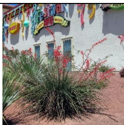
Hesperaloe ou Yucca rouge