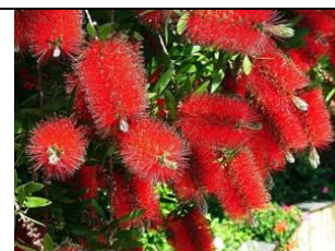
Callistemon ou Rince bouteille